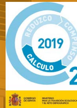
Huella de carbono según alcances (t CO 2 eq)

De forma complementaria, hemos hallado y registrado la huella de carbono de Alcance 1 y 2 generada por nuestra actividad desarrollada en la sede Renedo de Esgueva (Valladolid) en el año 2019, obteniendo el sello del MITECO (Ministerio para la Transición Ecológica y el Reto Demográfico).